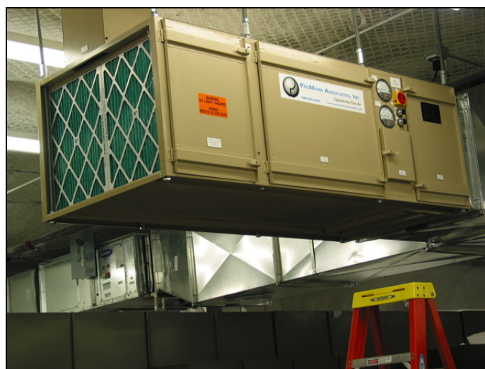
Figura 1 - Total Spectrum® instalat în conducta sistemului de ventilație

Sistemul de purificare a aerului Total Spectrum® (brevet în curs de omologare) este o tehnologie de ultimă generație care mărește dramatic eficiența filtrării convenționale, bazată pe substanțe active de filtrare. Rezultatul este un sistem puternic de purificare pentru orice tip de aer poluat din interiorul spațiilor rezidențiale și comerciale.