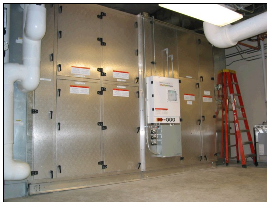
Figura 2 - Total Spectrum® instalat în cazinoul Dubuque, Iowa, SUA

Total Spectrum® poate fi proiectat în funcție de orice volum de aer și mărime. Detalii și datele de contact ale acestui client sunt valabile la cerere.